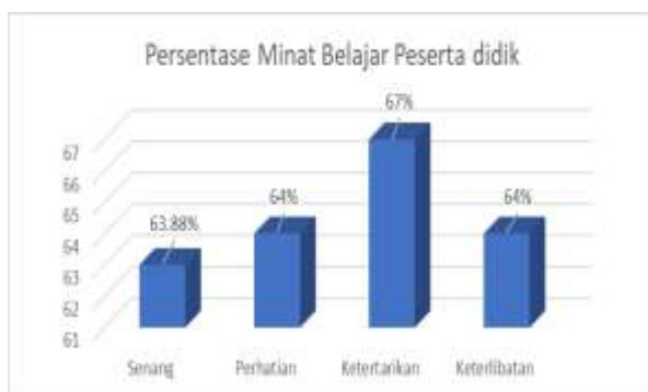
Gambar 2. Hasil persentase minat belajar peserta didik belum menggunakan model pembelajaran Think Pair Share

Dari tabel 6 terlihat bahwa persentase pada setiap pernyataan dari aspek keterlibatan peserta didik yang terdiri dari 6 pernyataan mendapatkan hasil rata-rata yaitu 64 % dengan kriteria Rendah. Sehingga dapat disimpulkan peserta didik kurang terlibat aktif dalam proses pembelajaran dengan menggunakan metode yang biasa guru berikan pada materi demokrasi dan hak asasi manusia.