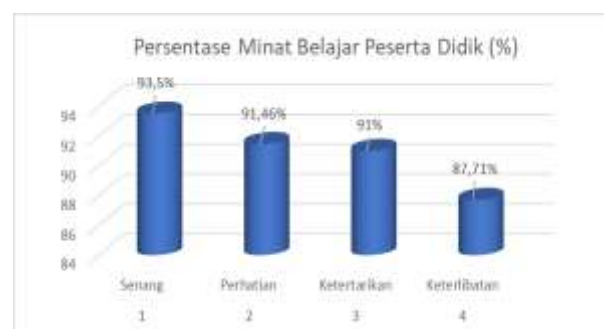
Gambar 3. Hasil persentase minat belajar peserta didik dengan model pembelajaran Think Pair Share

Dari tabel 10 terlihat bahwa persentase pada setiap pernyataan dari aspek keterlibatan peserta didik yang terdiri dari 6 pernyataan mendapatkan hasil rata-rata yaitu 87,71% dengan kriteria sangat setuju. Sehingga dapat disimpulkan peserta didik sangat terlibat aktif dalam proses pembelajaran dengan menggunakan model pembelajaran Think Pair Share yang berisi materi demokrasi dan hak asasi manusia.