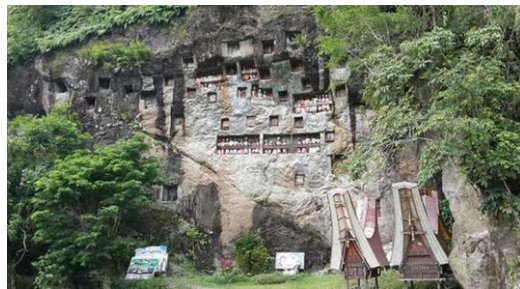
Gambar 1.2: Kuburan etnik di Pulau Toraja, Sulut