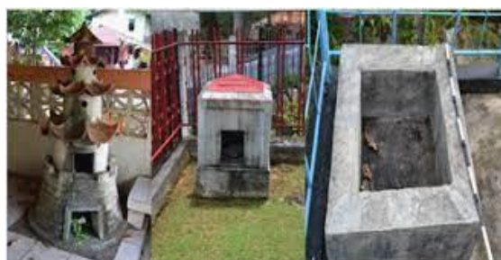
Gambar 1.4: Kuburan etnik Thionghoa yang dikuburkan bersama dengan etnik Maluku, di Kota Ambon.

Biasanya kuburan ini dapat ditemui di pemakaman umum. Beberapa kuburan campur etnik ini juga terjadi karena kuburan ini sudah berusia puluhan bahkan ratusan tahun. Adanya kuburan campur etnik menjadi tanda dialog antar-etnik sudah tercipta di kalangan masyarakat Indonesia terkhususnya di Ambon.