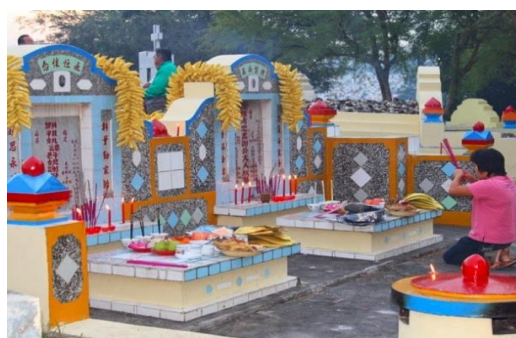
Gambar 3.4 Prosesi Cheng-Beng di Bangka Belitung