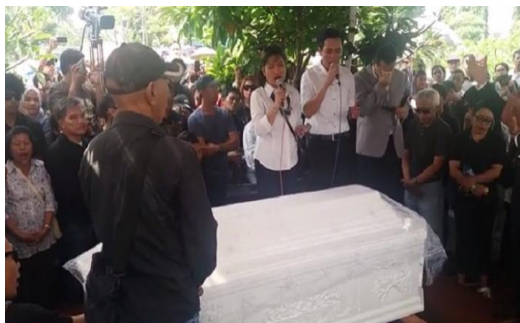
Gambar 3.1: Prosesi Pemakaman Kristen (penyanyi Mike Mohede)

Prosesi pemakaman merupakan salah satu praktik yang mutlak dilakukan bagi salah satu anggota keluarga yang meninggal. Biasanya jasad manusia yang meninggal akan dimakamkan berdasarkan beberapa tahapan. Sebagai manusia beradab, masyarakat pada zaman modern hingga post-modern ini menciptakan cara-cara pemakaman yang dinilai sebagai penghargaan terhadap anggota keluarga. Prosesi pemakaman terjadi dalam beberapa bentuk yakni secara adat maupun secara agama. Prosesi pemakaman yang dilakukan di kuburan campur agama biasanya dihadiri oleh kerabat-kerabat orang yang meninggal yang berasal dari agama lain bahkan berasal dari budaya lain.