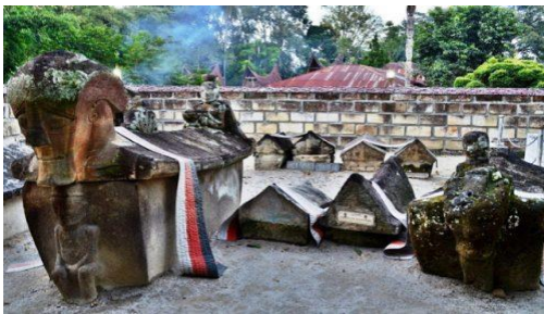
Gambar 1.1: Kuburan Etnik Batak di Pulau Samosir, Sumut.

Kuburan jenis ini merupakan kuburan campur etnik yang di dalamnya terdapat beberapa orang yang berasal dari satu etnik dan biasanya merupakan kerabat dalam satu suku. Biasanya kuburan ini merupakan kuburan etnik daerah atau suku di suatu tempat yang diidentifikasi sebagai bagian dari tradisi daerah tersebut. Cara pemakaman di kuburan ini sudah pasti menggunakan adat daerah atau adat suku setempat. Dalam jenis kuburan ini, agama tidak dipedulikan karena biasanya dapat ditemui lebih jelas di daerah-daerah pribumi yang masih melestarikan budaya dan kepercayaan lokal.