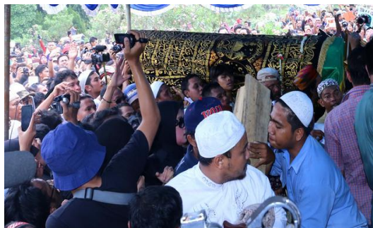
Gambar 3.2: Prosesi Pemakaman Islam (aktor Olga Syaputra)