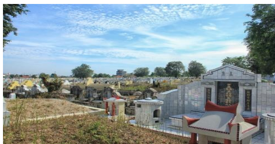
Gambar 1.3: Kuburan Etnik Tionghoa di Bangka Belitung