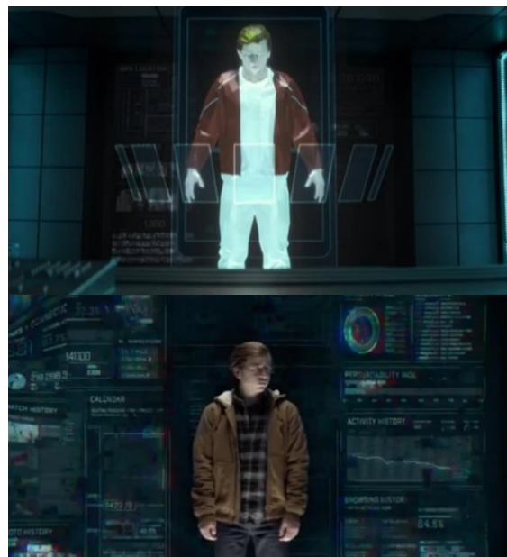
Gambar 10: Ilustrasi algoritma model pengguna

karena itu, digunakan symbol Kera (era primitif) sebagai penanda ketidaktahuan dan ketertinggalan yang dirasakan oleh Ben ketika tidak memegang ponsel.