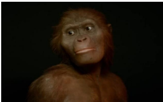
Gambar 9: Pemilihan symbol Kera yang melambangkan era primitif

masih rawan dan belum pandai menyaring komentar dan perkataan orang lain dari media sosial. Inilah yang disampaikan oleh film The Social Dilemma , bahwa media sosial memiliki dampak negatif yang meluas di masyarakat. Misalnya, komentar yang tidak pantas dapat menyebabkan seseorang tersakiti atau bahkan depresi. Lebih jauh lagi digambarkan, bahwa media sosial adalah salah satu faktor pendorong meningkatnya angka kematian akibat bunuh diri.