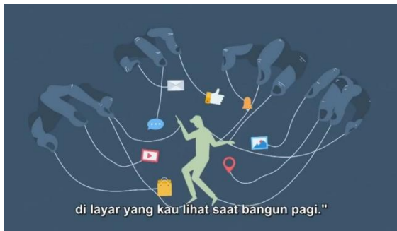
Gambar 1: Ilustrasi tangan, notifikasi, dan pengguna media sosial

menggunakan teori semiotika Charles Sanders Peirce. Berikut hasil analisis penulis mengenai tanda-tanda yang mengarah pada dampak negatif dari penggunaan media sosial.