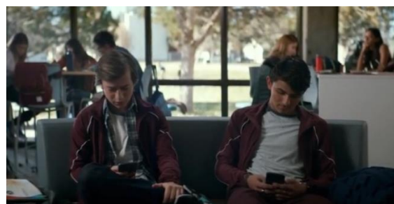
Gambar 5: Sosial media sebagai salah satu faktor berkurangnya interaksi interpersonal

merepresentasikan karakteristik penggunaannya. Terdapat 3 figur yang berperan sebagai algoritma yang memproses data dan informasi yang akan diperlihatkan pada pengguna untuk menciptakan sebuah model yang akurat mengenai penggunaannya. Adapun figur berbentuk manusia berwarna biru terang, menggambarkan proses penciptaan model pengguna media sosial (model dari pengguna sosial bernama Ben).