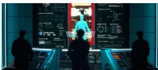
Gambar 4: Ilustrasi algoritma pengguna

Pada gambar 3, ditunjukkan scene saat Ben aktif menggunakan media sosial, seakan tidak bisa terlepas dari media yang tengah diakses tersebut. Scene menggunakan ponsel di beberapa tempat yang berbeda menandakan bahwa Ben menggunakan media sosial untuk berinteraksi hingga mencari informasi dimanapun ia berada.