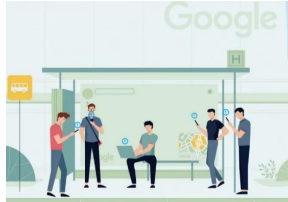
Gambar 2: Ilustrasi pengguna media sosial

Dalam scene tersebut, digambarkan beberapa tangan berwarna biru yang melambangkan pekerja di perusahaan media sosial bekerja. Pekerjaan tersebut meliputi pembuatan algoritma yang menyesuaikan karakteristik pengguna media sosial. Misalnya dengan memberikan notifikasi tentang aplikasi, impresi orang lain, pesan yang masuk, iklan yang ditampilkan, dan lain-lain. Sehingga secara tidak langsung, perhatian pengguna diarahkan pada aktivitas bermedia sosial terus menerus.